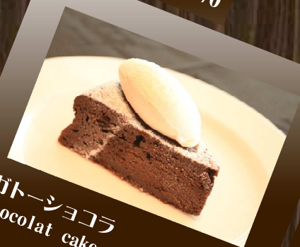
ガトーショコラ Chocolat cake 香り高いチョコレートの 風味を感じるケーキです