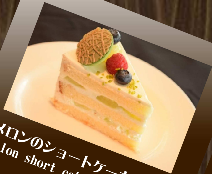
メロンのショートケーキ Melon short cake ハチミツで香り付けた メロンのショートケーキ