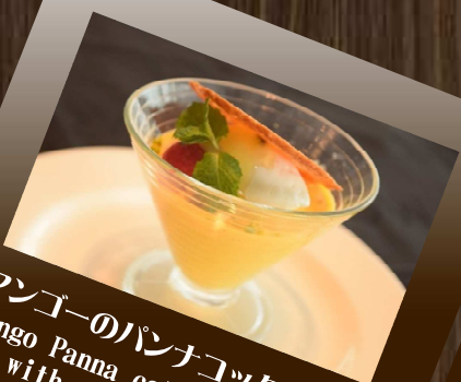
マンゴーのパナコッタ Mango Panna cotta with passionfruit sauce マンゴー風味のパナコッタに パッションソース