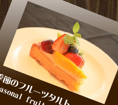
季節のフルーツタルト Seasonal fruit tart