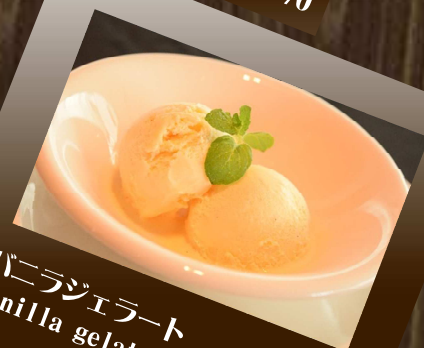
バニラジェラート Vanilla gelato