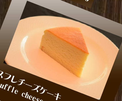
スフレチーズケーキ Souffle cheese cake クリームチーズとカスタード、 メレンゲで焼き上げました